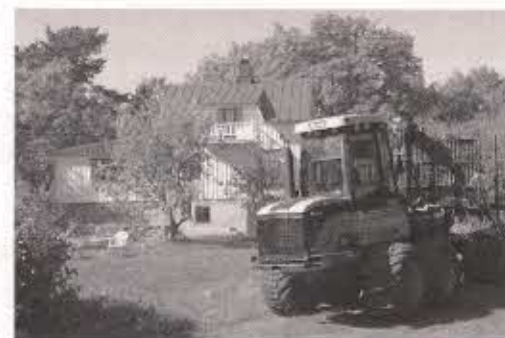
Under 2013 har bostadshuset målats och skog avverkats på Strömmen i Simskåla.

Skrivarhemmet Strömmen i Simskåla har varit öppet för besökare under maj-oktober. Antalet besökare uppgick totalt till ca 430 från Åland, riket, Sverige och Estland. Av dem utgjorde ca 180 personer deltagare i de s.k. Anni-vandringarna som anordnades av Vårdö biblioteksnämnd och som utgick från Strömmen. Eftersom vistelsestipendiet på Strömmen som blev ledigt hösten 2012 inte vann något